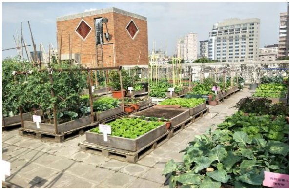
社區活動中心屋頂

為了鼓勵市民利用社區或機關學校的閒置空間，推展環保友善的都市農耕活動，臺中市政府於 105 年起開始推動「城食森林」計畫，透過專業團隊輔導市民以共同參與的方式，打造豐富多樣且循環永續的都市園圃，進而帶動社區營造、環境美學、社會照顧、環保生態、低碳永續及食農教育等各種效益。以下是為本計畫歷年輔導建置之各種「都市園圃」案例照片：